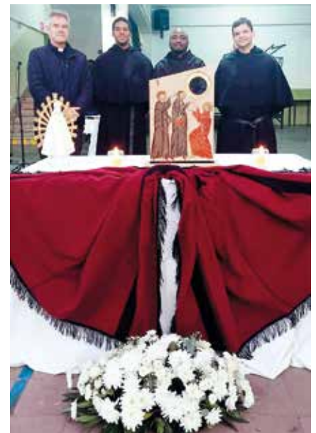
Agustinos con las reliquias de santos argentinos.

rechos", "un fracaso de la política y de la humanidad", "una claudicación vergonzosa, una derrota frente a las fuerzas del mal". Además, debido a las armas