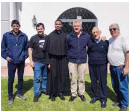
Comunidad de Salta en Ejercicios espirituales.

La gran tarea misionera consiste en el anuncio de Jesucristo. Este anuncio es creíble cuando nace de una experiencia de comunidad con Jesús y con su Espíritu y cuando tiene en cuenta el contexto