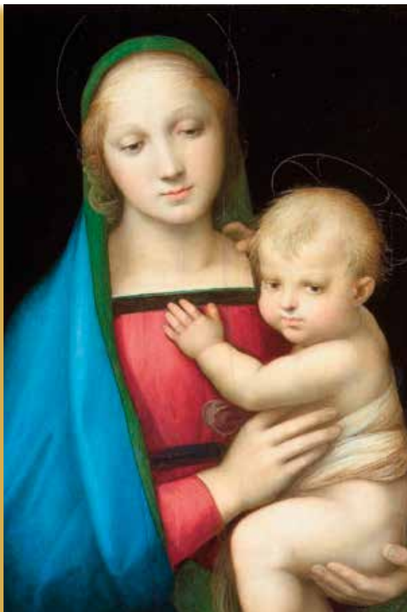
La Virgen del Gran Duque. Rafael 1504.