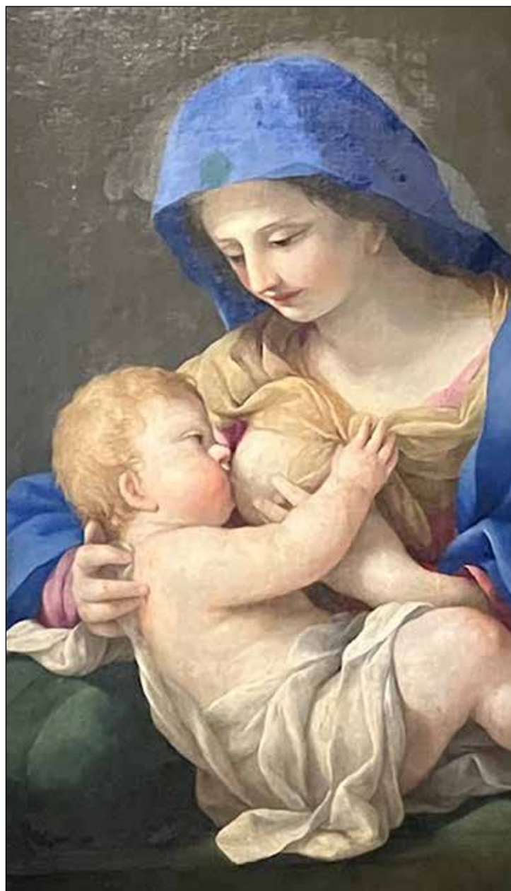
Virgen con Niño. (Detalle) Francesco Gessi (1588-1649). Museo de Bellas Artes. La Coruña.