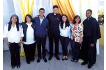
Equipo de pastoral del Colegio de Salta.

Toda manifestación de amor, en las Sagradas Escrituras, siempre se sella mediante un pacto, que constituye la Alianza. En Salta, entre aquellos primeros hombres y mujeres y el Cristo y la Virgen del Mila-