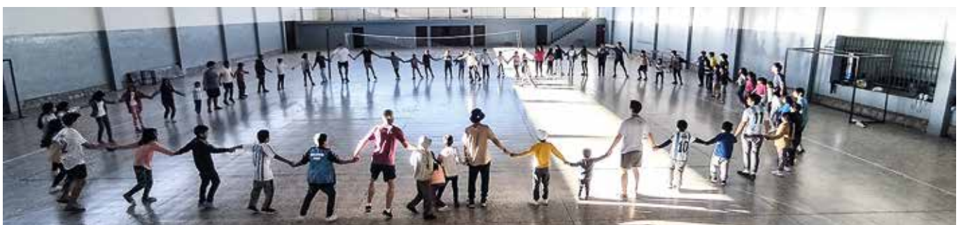
Polideportivo del Colegio de Salta.

gro, se selló el pacto de la alianza con el amor de Dios. Este es el pacto secular, que los antepasados, los abuelos y padres, y nosotros, emocionados, renovamos año a año en la clausura de cada Milagro: “Que Tú, dulce Jesús, serás siempre nuestro, y que nosotros seremos siempre tuyos”. En 1902, a pedido del Obispo de Salta, Mons. Matías Linares, el Papa León XIII concede la Coronación Pontificia de la Virgen del Milagro, y el 13 de septiembre en presencia de los Obispos Argentinos se corona al Señor y la Virgen del Milagro... El 28 de marzo de 1806 el Papa Pío VII erige la Diócesis de Salta. En 1943, Pío XI la eleva a Arquidiócesis. Como testimonio de gratitud por los milagros reali-