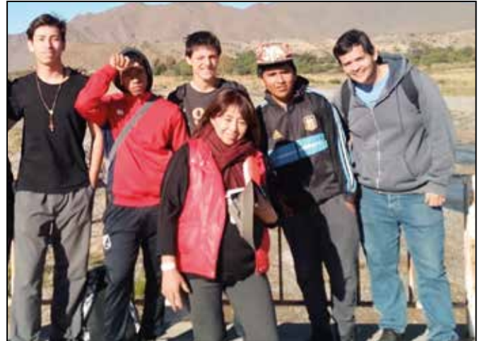
Grupo de jóvenes de Salta.

Subraya el Papa Francisco que la guerra: no es "un fantasma del pasado" y representa la "negación de todos los de-