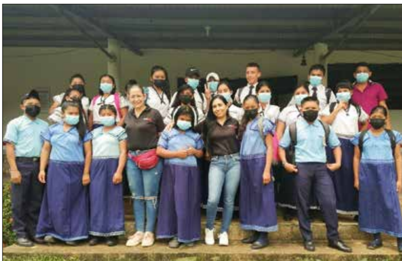
Jóvenes Ngöbe, Panamá

ha colaborado durante dos años aportando 9.000 €, ha sido el pago de tutores, que viven continuamente con los jóvenes en la Residencia, y cuya labor es cuidarlos y acompañarlos en todos