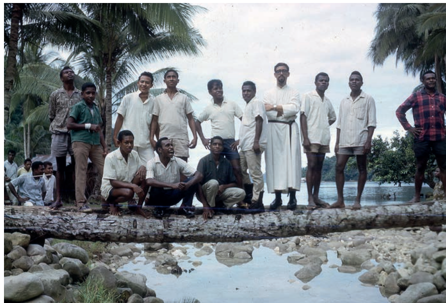
El P. Niño con sus alumnos en Skolai, Guru Bawah, en 1967.

La firmeza de la imagen entera proclama una vida que fluye, con el pulso inextinguible de la parábola y la profecía, por los avatares de la historia, lama dan baru , antigua y nueva.