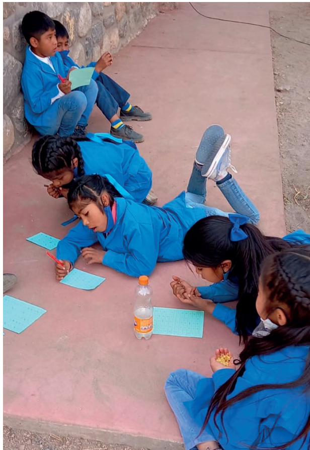
Alumnos de la escuela de Cafayate.

Como nuestro centro educativo está ubicado a 7 km. del pueblo de Cafayate y además concurren niños y adolescentes de parajes aledaños, 48 de ellos, los que más necesidad tienen, permanecen en el albergue de lunes a viernes. Lo que hace que la escuela esté en funcionamiento las 24 horas.