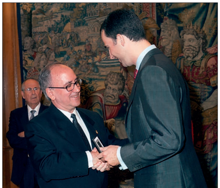
El P. Joaquín recibiendo en 1990, de manos del Príncipe Felipe, el Premio Bartolomé de las Casas.