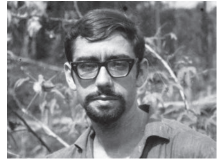
El P. Niño en Merdei, Nueva Guinea, en 1963

Los pies, apoyados levemente, son de un ágil mensajero caminante, de aldea