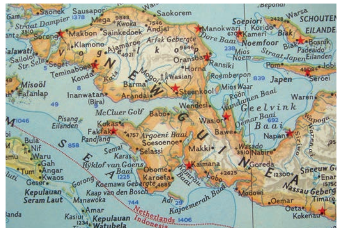
Mapa de Nueva Guinea. Irian Yaya.

en aldea, por los senderos que su afán redentor abre en la tierra inexplorada.