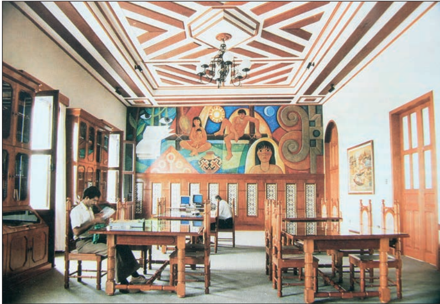
Sala de lectura de la Biblioteca Amazónica de Iquitos.

Aparte su colaboración asidua en periódicos como “El Comercio” (Lima) – y antes en medios españoles y otros editados por la Orden Agustiniense -, este misionero dirigió, casi hasta el fin de su vida, “Monumenta Amazónica”, una colección, lamentablemente inconclusa, formada por más de treinta gruesos volúmenes que compendian todo lo publicado hasta hoy por todo el planeta respecto a la región amazónica. Una de las tareas que afianzaron su autoridad en esa materia, y empresa que le granjeó numerosos títulos académicos “honoris causa” en diversas universidades americanas. De ahí que en 2014, y según una encuesta avalada por Marca España, figurase él entre los cien españoles más influyentes del mundo.