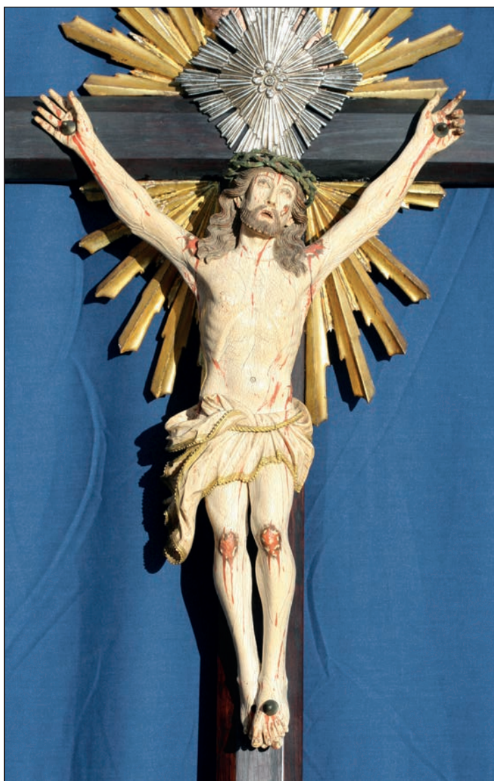
Cristo crucificado. (Detalle). Marfil indo-portugués. S. XVII. Museo Oriental. Real Colegio PP. Agustinos, Valladolid.