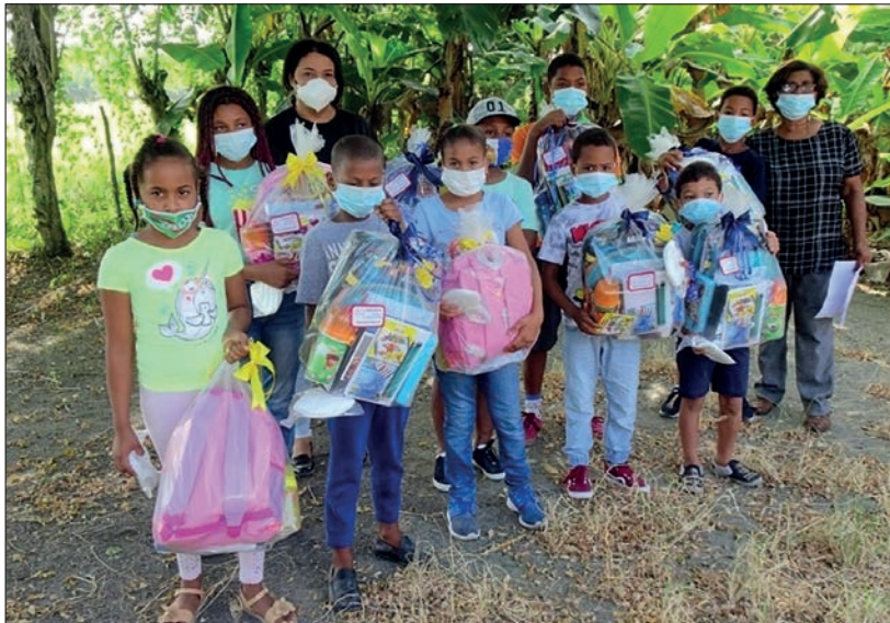
Niños y niñas recibiendo el material escolar.

oftalmológico. A partir de los diagnósticos emitidos, se entregan vitaminas, medicinas, cepillo de dientes, dentífrico y, si fueran necesarias, las gafas correspondientes.